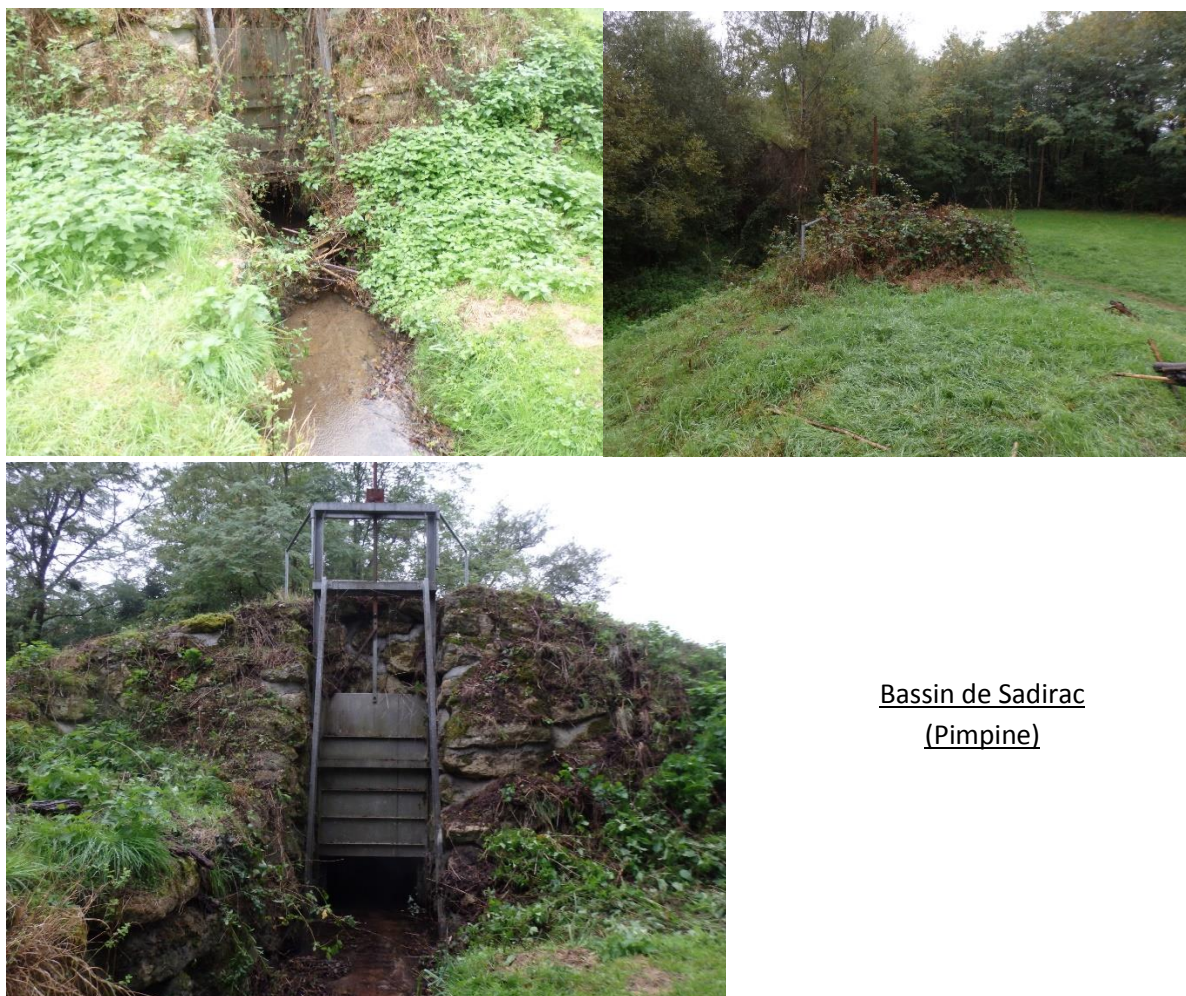
Bassin de Sadirac (Pimpine)