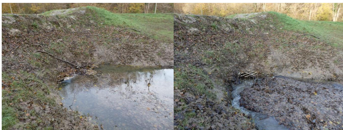
Bassin de l'Artolie

En particulier le Bassin de l'Artolie, situé dans un secteur forestier, demande des interventions fréquentes afin de rétablir un fonctionnement optimum.